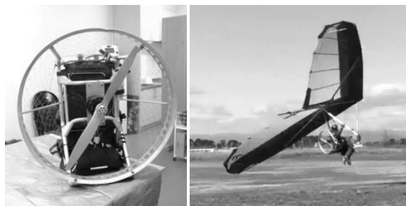
モーターユニット

フライトテストでは1発目でみごとに浮くことができました。まだまだ開発中ですが、将来的には障害者も自分の操縦で地上から飛び立てるような新たな機体につなげていきたいと思っています。