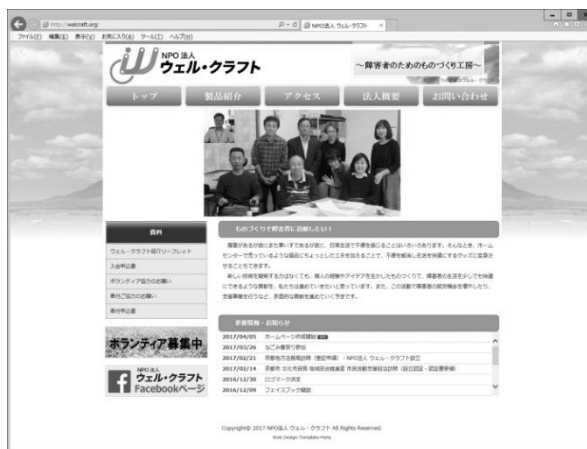
NPO法人 ウェル・クラフトのホームページ

そして去年の11月、NPO法人 ウェル・クラフトとして設立総会を開催することができ、今ではNPO法人として依頼や要望を受け、製作体制を整えようとみんなでがんばっています。リーフレットを使って宣伝を進めたり、就労支援に繋がるよう他の事業所の見学に行ったりもしています。