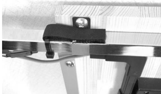
連結用のマジックテープ