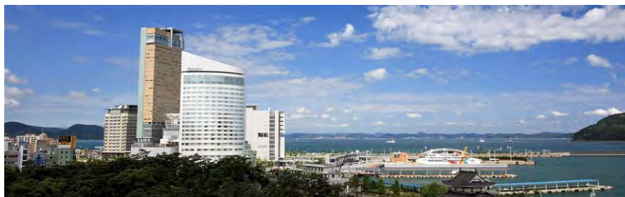
JR ホテルクレメント高松・周辺の景観（宿泊予定）

岡山から快速マリンライナーで瀬戸大橋を渡り1時間。高松駅、サンポート高松周辺は瀬戸内を感じられる素晴らしいロケーションです。ぜひ四国へいらっしやってください。お待ちしております。